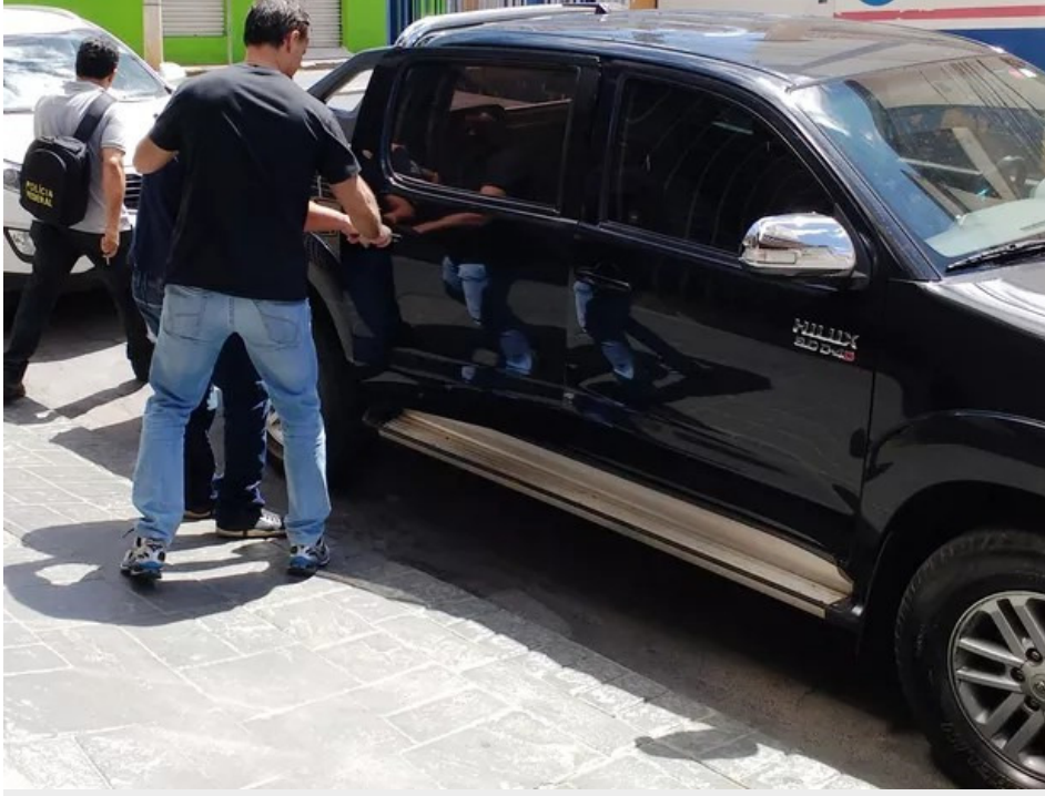
Agentes com um dos presos em Montes Claros

A Polícia Federal realizou neste domingo (6) operações em pelo menos 8 estados para combater fraudes contra o Exame Nacional do Ensino Médio ( Enem ), que acontece neste final de semana. Foram cumpridos mandados de prisão, mas até a última atualização desta reportagem a PF ainda não tinha informado quantas pessoas foram presas.